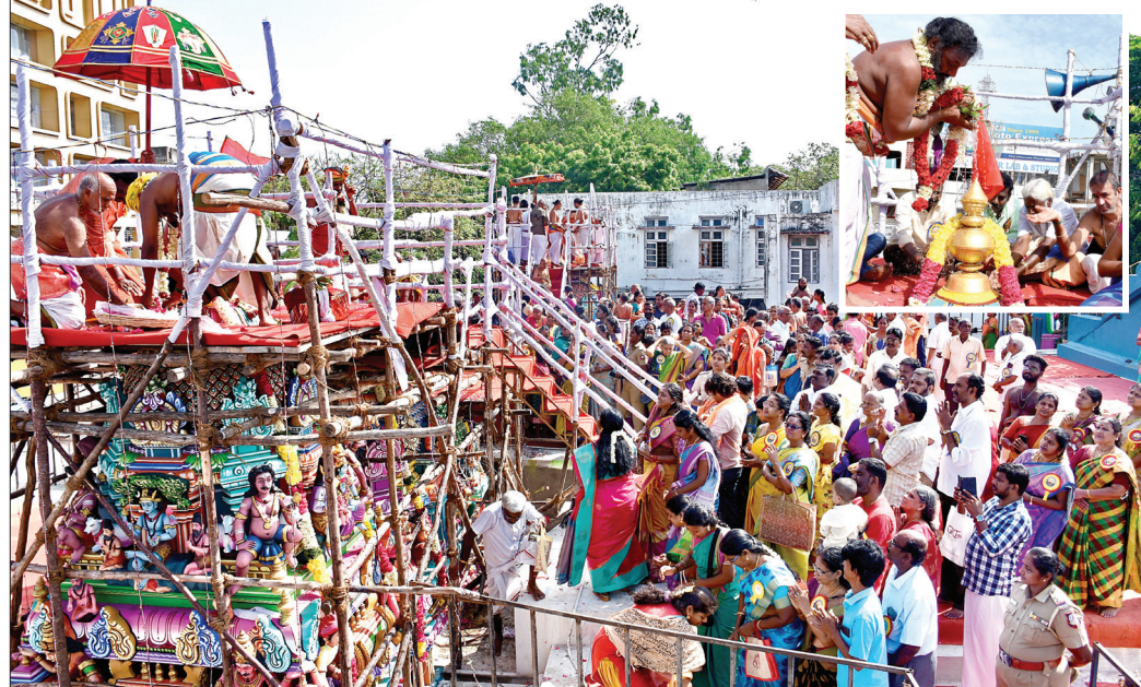
தாம்பரம் பேருந்து நிலையம் அருகே உள்ள செல்வ விநாயகர் மற்றும் கோதண்டராமர் கோயில் சும்பாபிஷேகம் நேற்று விமரிசையாக நடைபெற்றது. 19 ஆண்டுகளுக்கு பின் நடைபெற்ற சும்பாபிஷேக விழாவில் ஏராளமான பக்தர்கள் கலந்துகொண்டு தரிசனம் செய்தனர்.