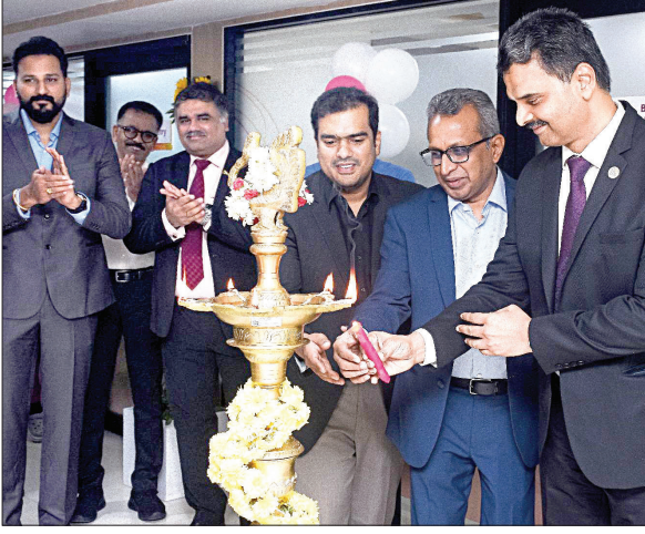
ரேடியல் சாலையில் உள்ள காவேரி மருத்துவமனையில் அதிநவீன காது மூக்கு தொண்டை பிரிவு தொடக்கப்பட்டுள்ளது.

சென்னை ரேடியல் சாலையில் உள்ள காவேரி மருத்துவமனையில் அதிநவீன காது மூக்கு தொண்டை பிரிவு தொடக்கம் நடைபெற்றது. ரேடியல் சாலை காவேரி மருத்துவமனையில் அதிநவீன காது மூக்கு தொண்டை பிரிவு தொடக்கம் நடைபெற்றது.